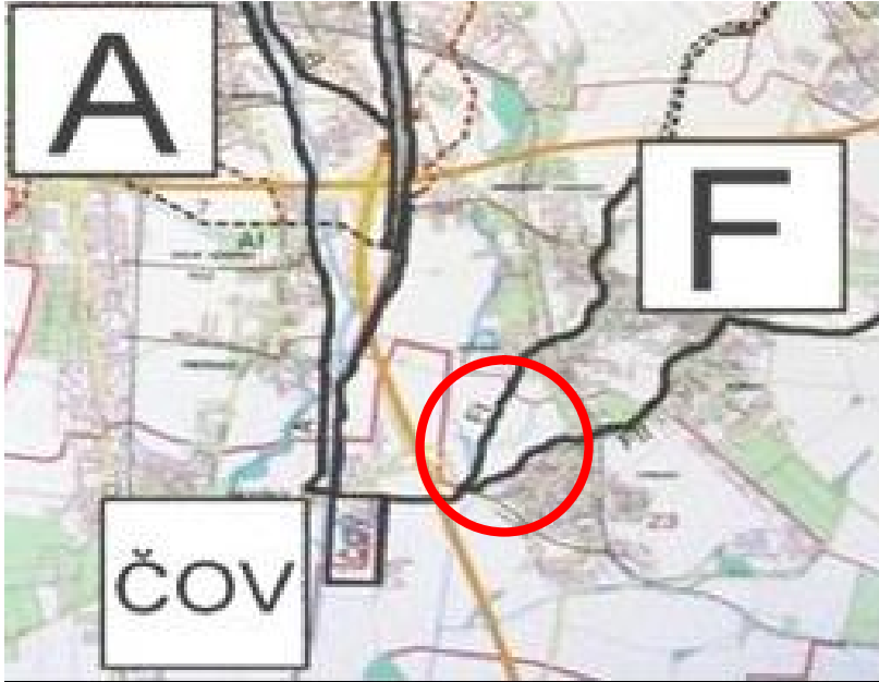
Obr. Situování hlavních kanalizačních sběračů v zájmovém území.